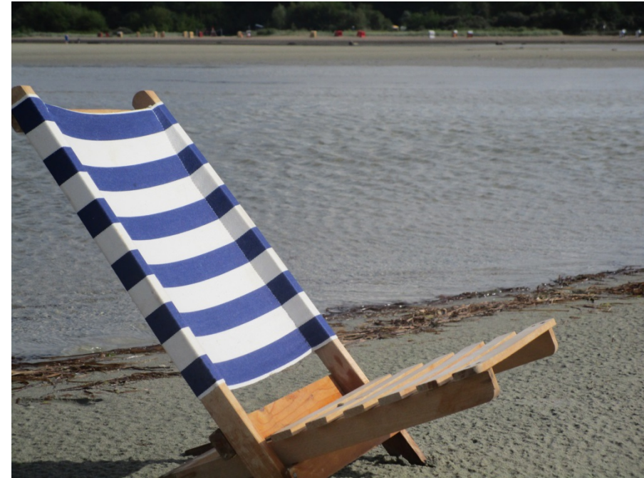
Zwei kleine Strandstühle und Beach-Schläger befinden sich in der Wohnung.

Konrad Kutt – Trabener Str. 14 b, 14193 Berlin Tel.: 030-891 51 24, Handy: 0173 601 491 2