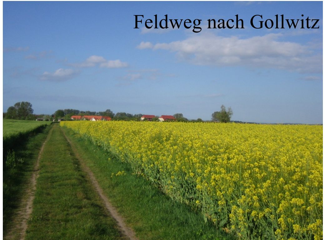
Feldweg nach Gollwitz