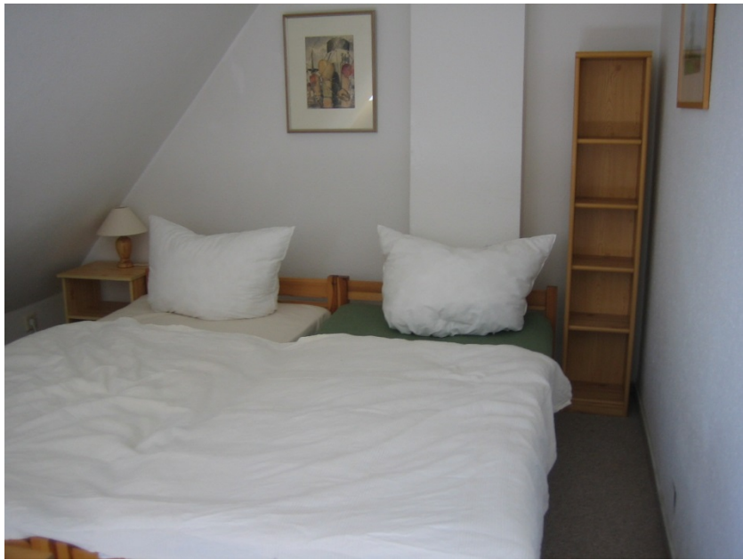
Doppelbett und Liege, Tisch und Schrank