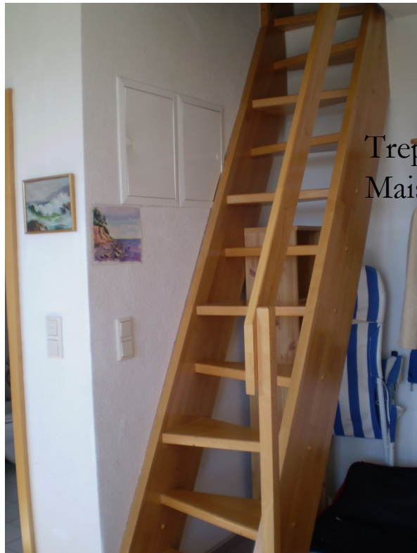
Treppe zur Maisonette